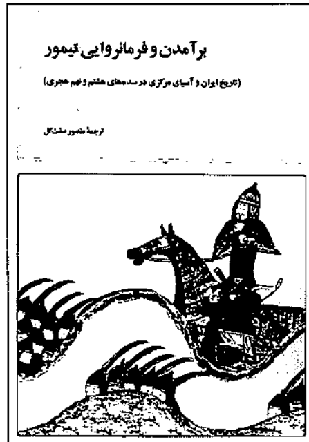
برآمدن و فرمانروایی تیمور

لذا منابع تاریخ نگاری تیموری همواره برای ما مشحون از انبوه رویدادهایی بوده است که جز تحجیر و تحسر برای خواننده حاصلی نداشته و گویی صدای یکدست و یکنواخت و بدور از هر زیر و بم و فراز فرودی است که جز ملالت را به دنبال نمی آورد. اما انتشار کتاب برآمدن و فرمانروایی تیمور نوشته خانم بناتریس منز، استاد تاریخ دانشگاه تافت ایالات متحده را می توان تحولی در این عرصه دانست.