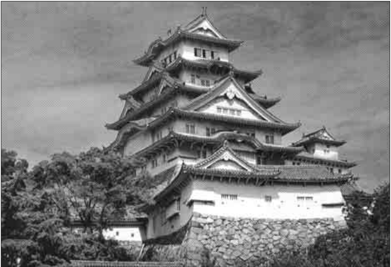
برج اصلی ارگ هیومه جی، معروف به ارگ حواصل سفید - زیباترین نمونه معماری قلعه در ژاپن

نشد. پیوند مستقیم دنیای جدید غربیان با پدیده‌ای اقتصادی موسوم به استعمار در بسیاری از نقاط جهان نتایج ناگواری به دنبال آورد و بسیاری از زمینه‌های جمعیتی و سرمایه‌ای کشورهای آفریقایی و آسیایی را با بحران مواجه ساخت. اما ژاپن با در پیش گرفتن سیاست انزوا توانست از نتایج زیانبار استعمار اقتصادی به دور ماند. آنچه در اینجا به ژاپنی‌ها کمک بسیار کرد از یک سو همسایگی با کشور بزرگ و ثروتمند چین بود که توجه همگان را جلب می‌کرد و آن اندازه امکانات داشت که همه استعمارگران را به خود مشغول سازد. لذا ژاپن از آسیب استعمار به دور ماند. از سوی دیگر پس از کشف آمریکا حدود سه قرن طول کشید تا کشوری به نام ایالات متحده آمریکا در مقیاسی جهانی در اقیانوس آرام ظهور کند و دریابد که ژاپن بر راه آن به چین واقع شده و لذا باید دروازه‌هایش را گشود. همچنین از اکتشافات جغرافیایی تا انقلاب صنعتی تا آن اندازه مقتضیات صنعتی و تکنیکی شرایط جغرافیایی و انسانی را تحت تاثیر قرار نداده بود که فاصله ژاپن را با دیگران طولانی سازد. لذا چند قرن انزوای ژاپن نه تنها ضرری متوجه آن کشور نداشت بلکه به عقیده نگارنده بیش از هر چیز عزت نفس را به عنوان سرمایه‌ای اساسی برای ژاپنی‌ها حفظ کرد. این «عزت نفس» هرچند از سادگی و حتی ساختاری دهقانی برخوردار بود مانع از «بهت و حیرت» ژاپنی‌ها در برابر ترقیات دنیای جدید شد و به آنان امکان داد تا در حالتی از متانت، طمأنینه و انتخاب که روح واقع‌بینی بر آن سایه افکنده بود به استقبال دنیای معاصر بیایند.