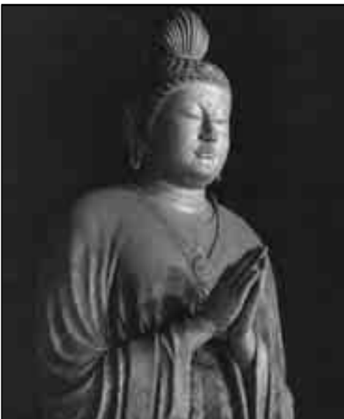
مجسمه «گاکو بوساتسو» - نمونه‌ای از پیکر تراشی بودایی در دوره نارا