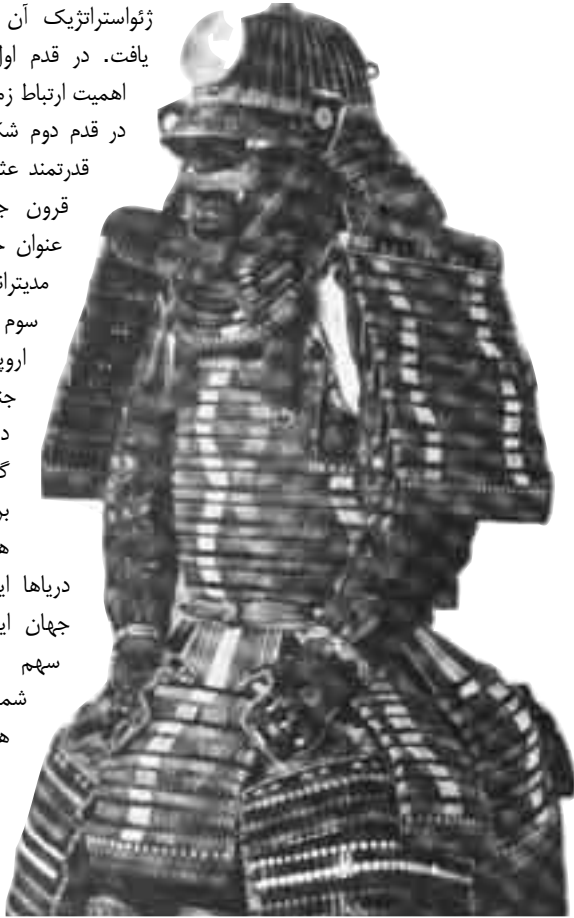
لباس رزمی (زره) یک جنگجوی ژاپنی در قرون گذشته.