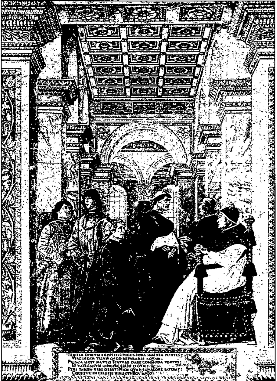
تصویر پالتینا (شاعر ایتالیایی) در حضور پاپ سیکستوس چهارم اثر Melozzo da Forlì